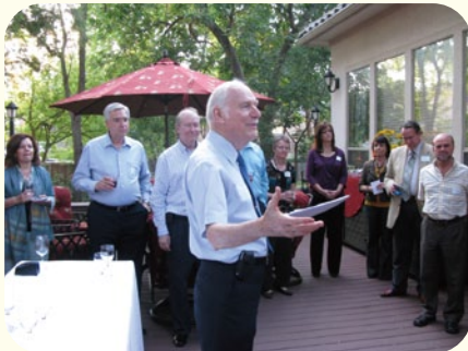
●アメリカ学院理事の皆さんとの野外会食パーティー