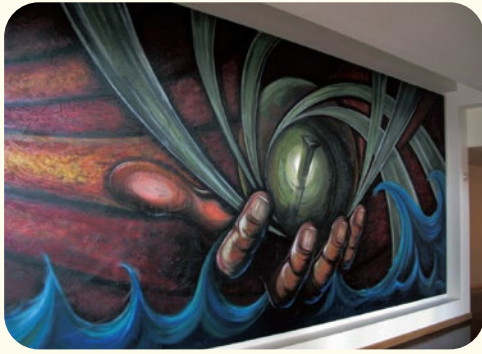
●新たに建設中の創造科学館。正面ホールの天地創造の絵