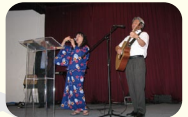
●メキシコの教会での奉仕