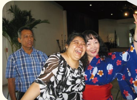
●車椅子から立ち上がり、喜ぶ教会メンバー